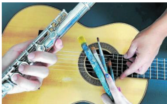
La flauta, la guitarra y los pinceles son fuente de inspiración.