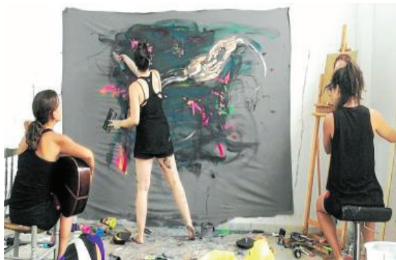
Las tres artistas durante uno de los ensayos del espectáculo 'Proximidad emocional'.